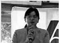
ご来賓の黒澤署長