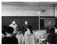
お二人に感謝の言葉