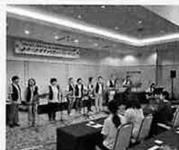
メンバーのさわやかなコーラス