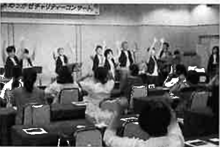
会場が大いに盛り上がり