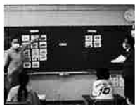
二人は息ピッタリ